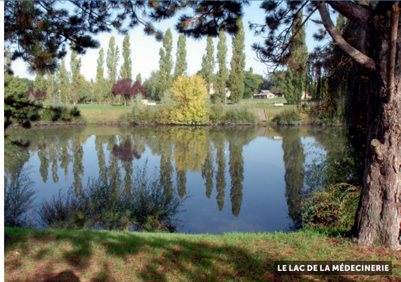
LE LAC DE LA MÉDECINERIE

Document sans échelle et non contractuel.