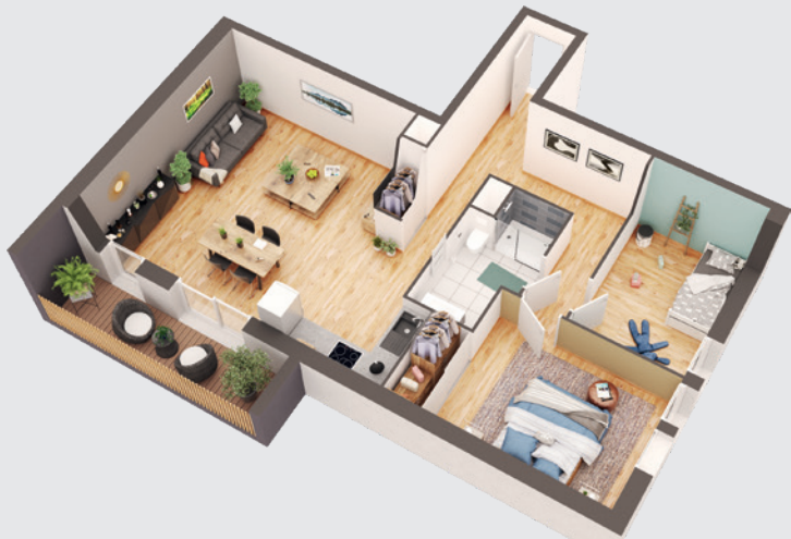
MODÈLE T3, LOT 106 AU PREMIER ÉTAGE

Document sans échelle et non contractuel.